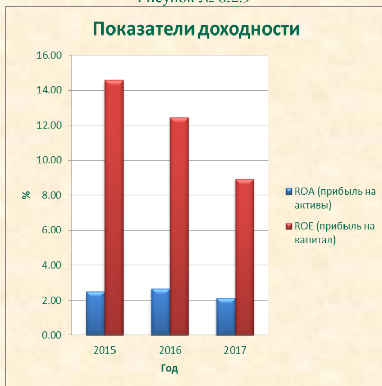
Рисунок № 8.2.9

За 2017 год собственные средства (капитал) Банка увеличились на 73 283 тыс. руб. или более чем на 7 % и составили 1 096 203 тыс. руб.