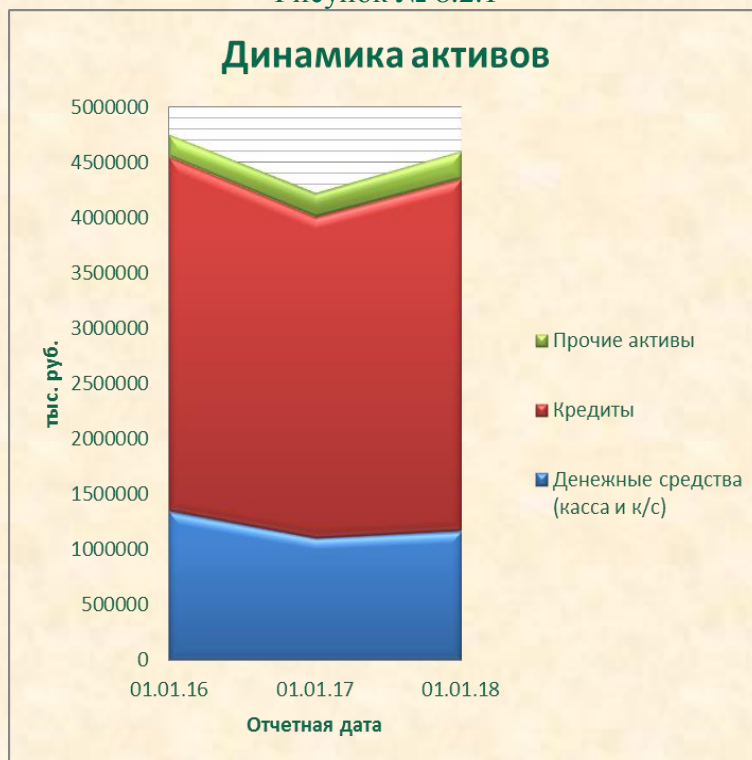
Рисунок № 8.2.1

Количество работающих счетов, открытых корпоративным клиентам по состоянию на 01.01.2018, составляет 1064 (прирост на 11,2%). Количество счетов, открытых частным клиентам по состоянию на 01.01.2018, составляет 2504 (прирост 2%) Таким образом, вследствие улучшения экономической ситуации, а также в результате принимаемых в Банке мер удалось стабилизировать клиентскую базу и зафиксировать небольшой ее прирост.