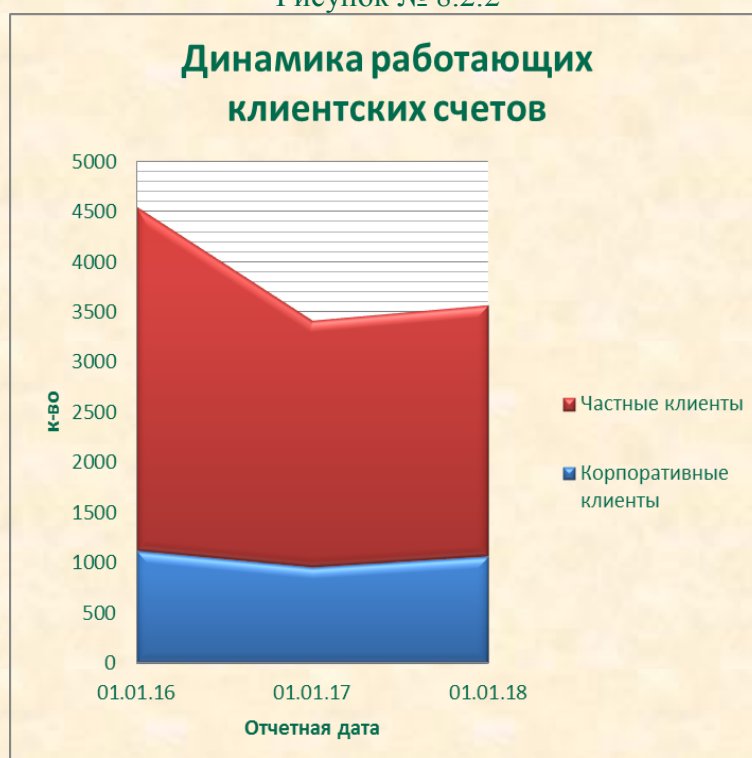
Рисунок № 8.2.2

Количество работающих счетов, открытых корпоративным клиентам по состоянию на 01.01.2018, составляет 1064 (прирост на 11,2%). Количество счетов, открытых частным клиентам по состоянию на 01.01.2018, составляет 2504 (прирост 2%) Таким образом, вследствие улучшения экономической ситуации, а также в результате принимаемых в Банке мер удалось стабилизировать клиентскую базу и зафиксировать небольшой ее прирост.