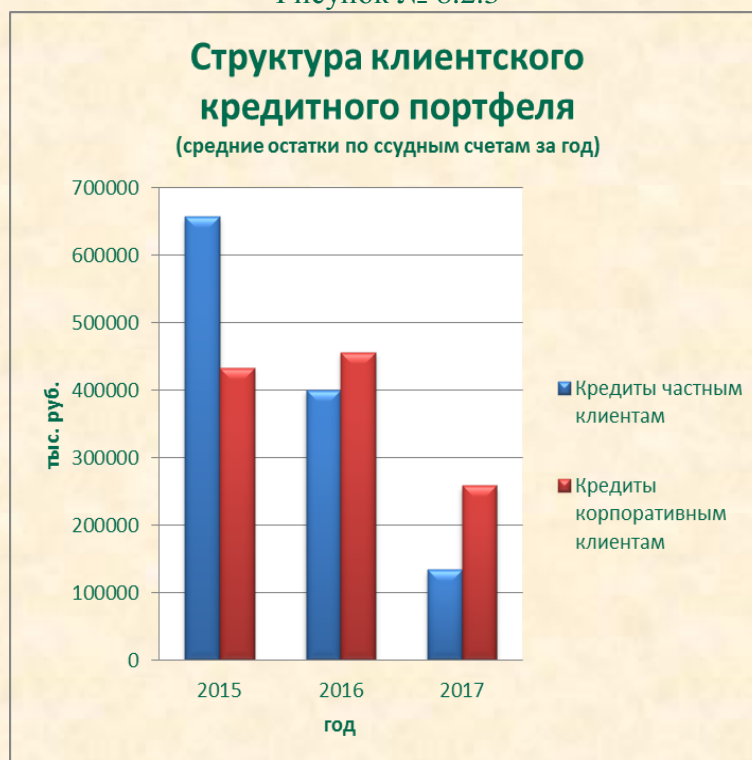
Рисунок № 8.2.3

В 2017 году переломлена тенденция снижения ресурсной базы Банка – остатки денежных средств юридических и физических лиц вновь получили тенденцию к росту.