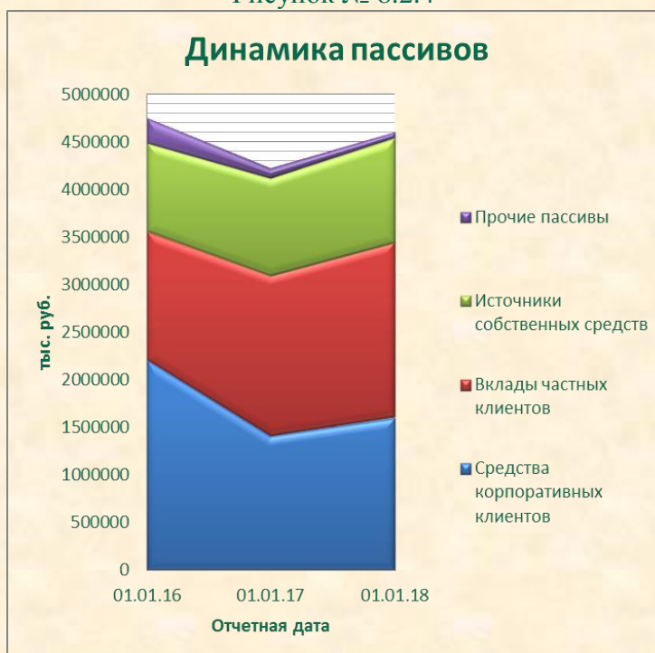
Рисунок № 8.2.4

В 2017 году переломлена тенденция снижения ресурсной базы Банка – остатки денежных средств юридических и физических лиц вновь получили тенденцию к росту.